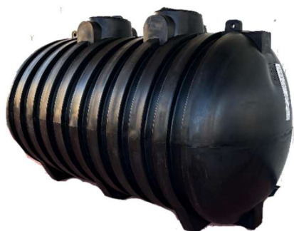
7000 OR DA INTERRO