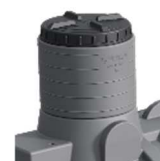
PROLUNGA MODULARE OPZIONALE